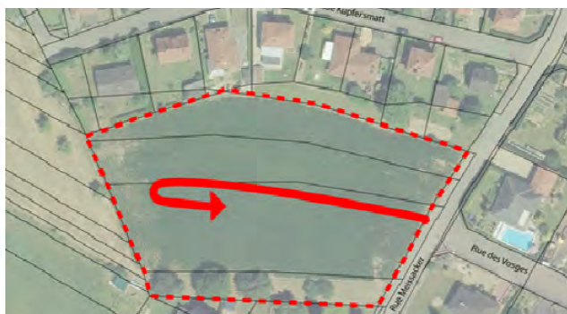
Illustration 2: le PLU modifié supprime la parcelle n°331 (qui est classée en UBb) afin de ne pas altérer les accès à la dernière parcelle privative