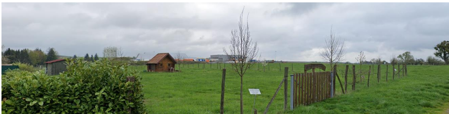
D1 – Verger Ecole en zone UEb

A ce titre, ces vergers sont identifiés au PLU au titre de l'article L151-23 du Code de l'Urbanisme, en tant qu'élément de paysage à protéger pour des motifs d'ordre écologique.